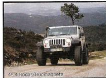
4º 4 Rodas/Duomagnete