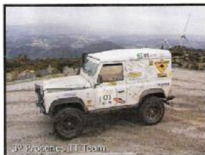
3º Provetes TT Team