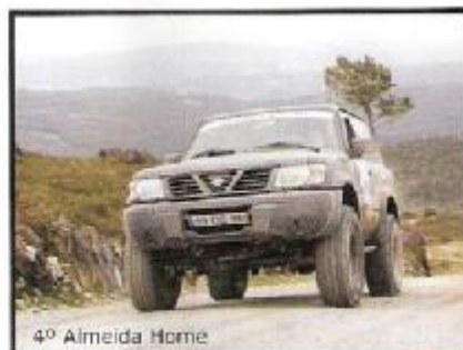
4º Almeida Home