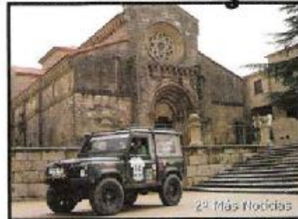
2º Más Nodias