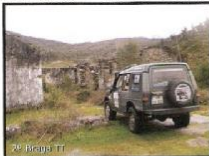
7º Braga TT

Desta forma, o "Team All4x4" tem-se mostrado muito à vontade na descoberta dos "waypoints" e assume a liderança desta nova competição, com três vitórias em quatro provas já disputadas. Faça chuva ou brilhe o sol... nada tem demovido as equipas na escolha da melhor estratégia para atingir o maior número de pontos. Com arranque em Soure, mais de três dezenas de equipas aceitaram o desafio da "Lazer Para Todos" numa jornada em que as condições atmosféricas adversas