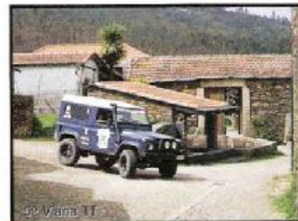
5º Viana TT