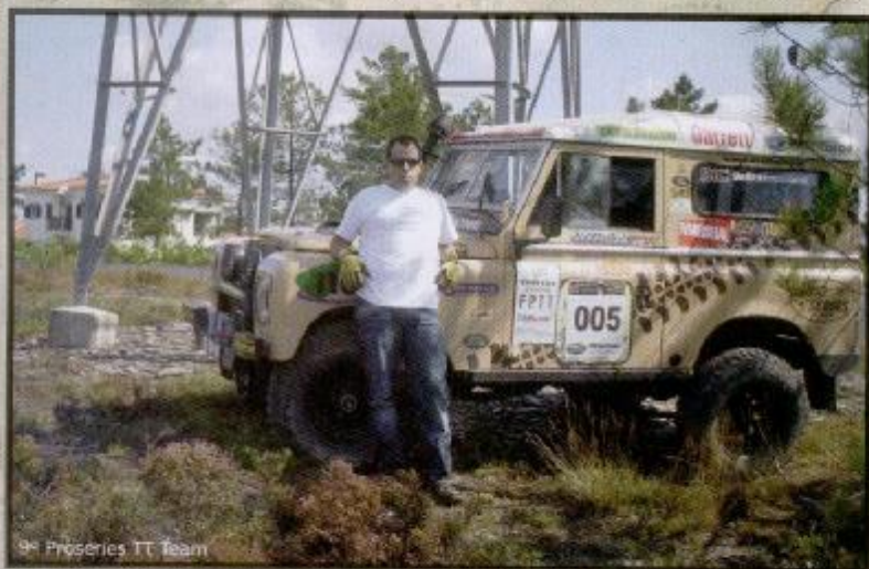
9ª Proseries TT Team